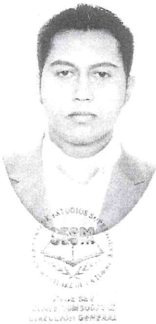
Firma del Alumno