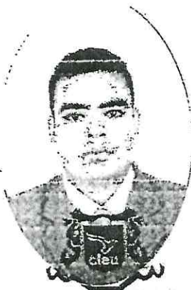
COLEGIO LIBRE DE ESTUDIOS UNIVERSITARIOS CAMPUS VERACRUZ DIRECCIÓN GENERAL CLAVE DE LA INSTITUCIÓN 30MSU0980C

Licenciado en Criminología y Criminalística