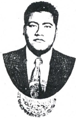
Secretaría de Educación Pública PUEBLA, PUE.