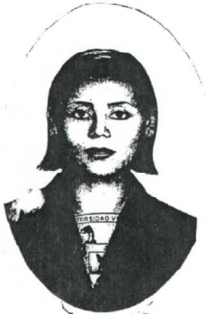
UNIVERSIDAD VILLA RICA