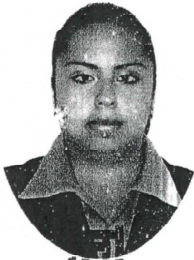
CENTRO DE ESTUDIOS SUPERIORES DE CORDOBA