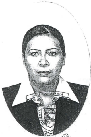
UNIVERSIDAD VILLA RICA