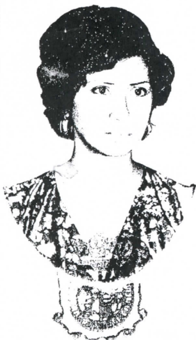
OFIC. LIG. MATBE