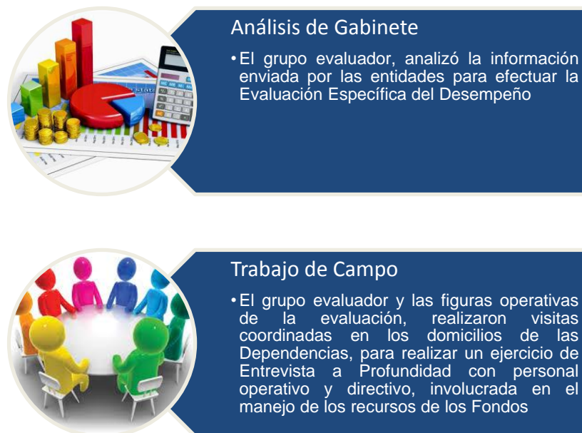
Figura 1, Metodología de la Evaluación